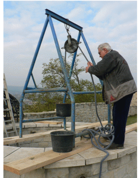
Hamvas Márton a kötélnél