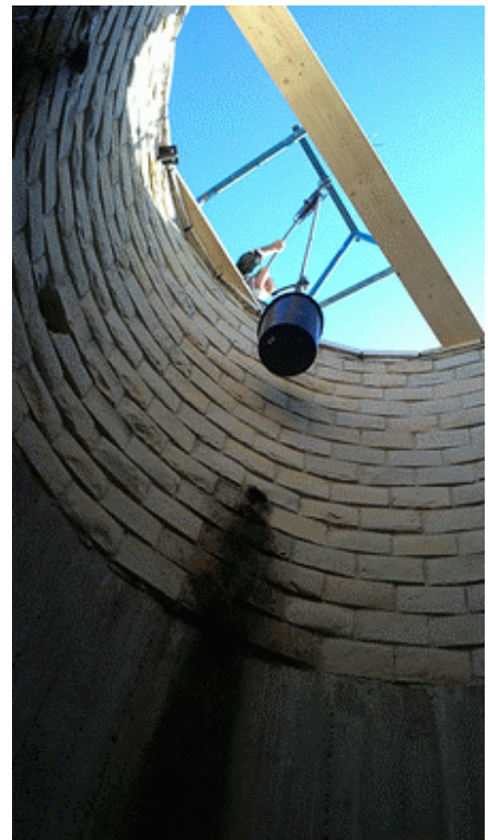
Kút a vödörrel alulnézetből